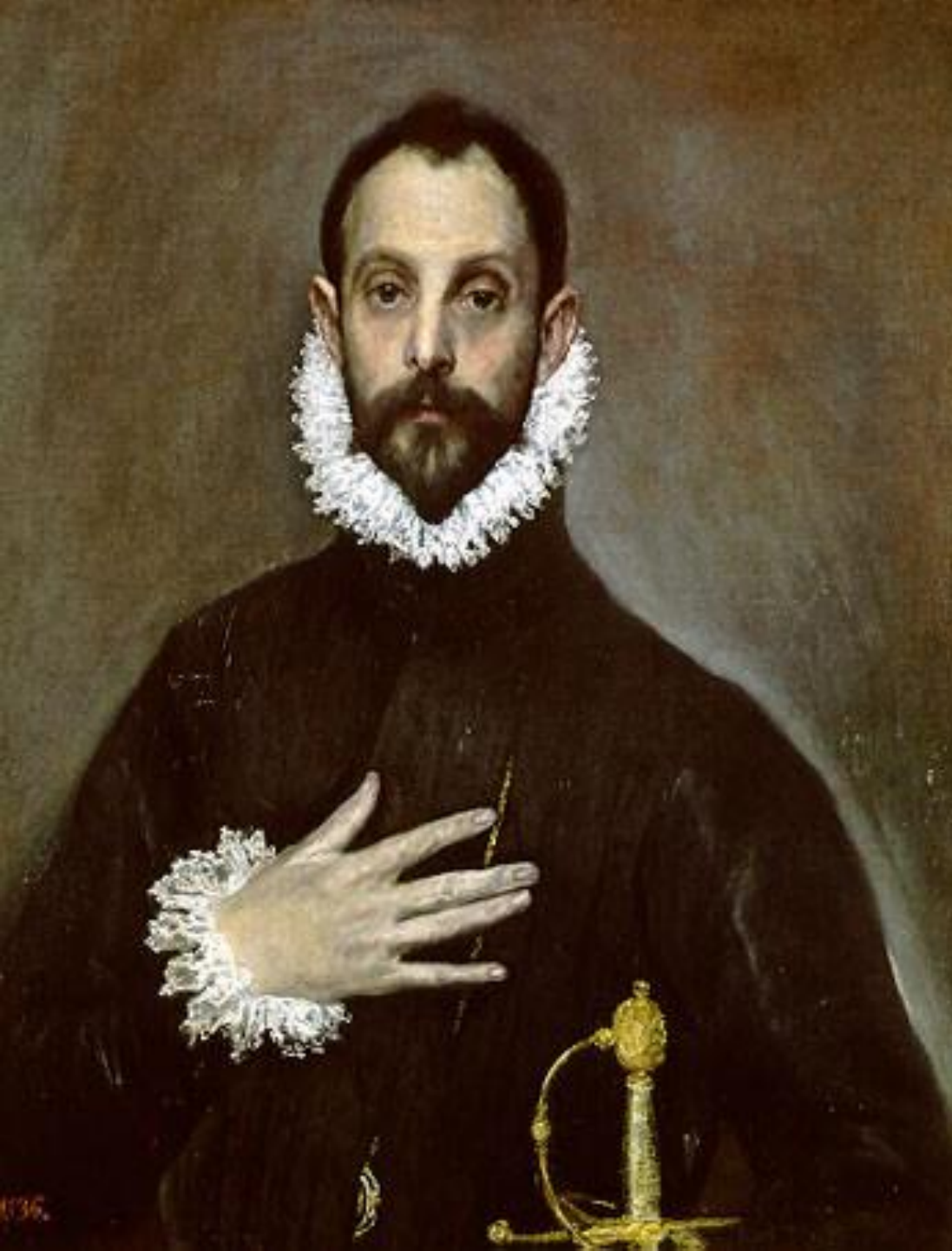
Retrato del caballero de la mano en el pecho