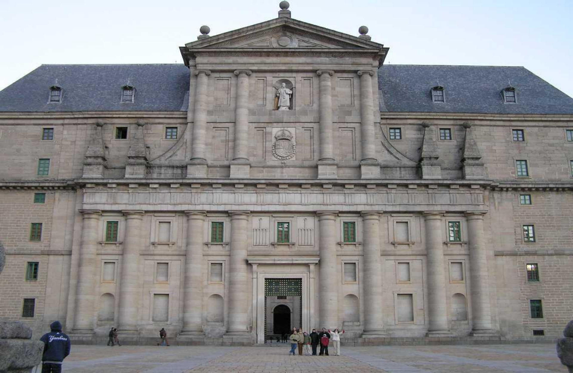
ESTILO HERRERIANO : El Monasterio del Escorial.