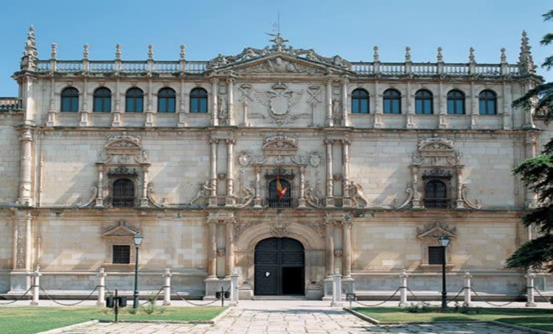
ESTILO PURISTA : Fachada de la Universidad de Alcalá de Henares.