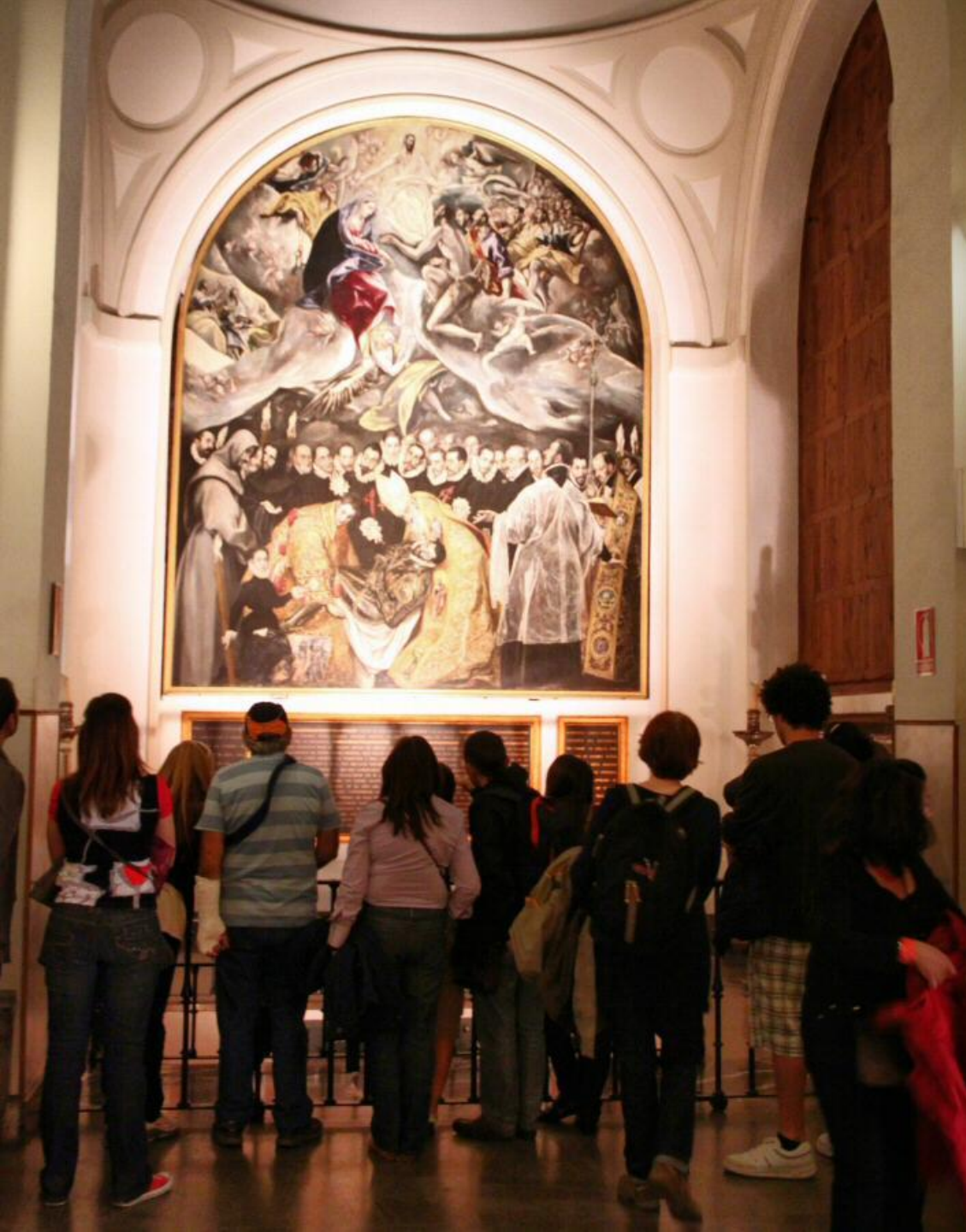
Iglesia de Santo Tomé (TOLEDO)