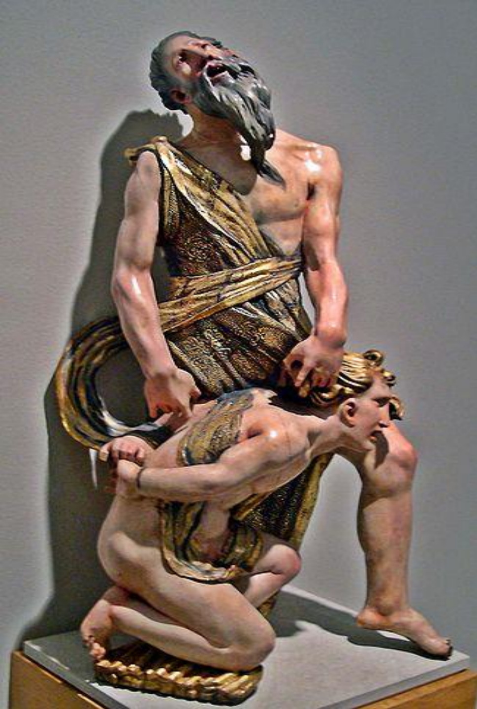
El Sacrificio de Isaac.